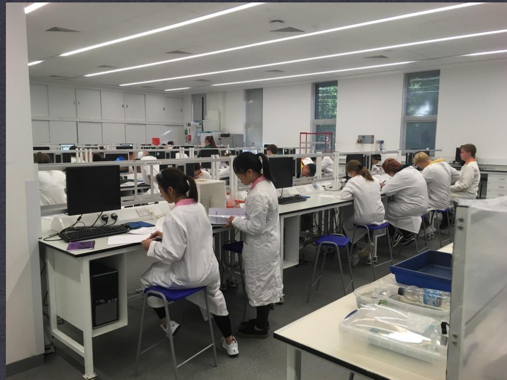
Practicals, University of Kent