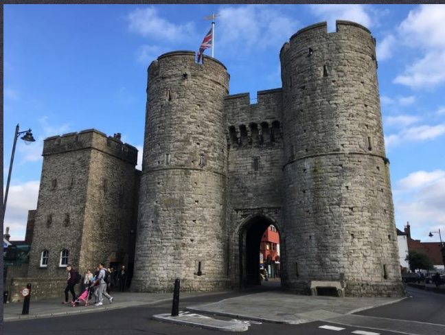
West gate, Canterbury